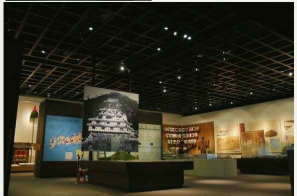
萩の歴史・自然・民俗・文化を展示。ファン必見！高杉晋作資料室も