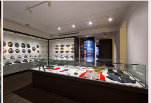
世界遺産ビジターセンターと幕末ミュージアム（2号館）